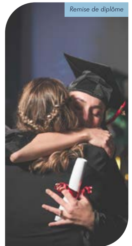
Remise de diplôme